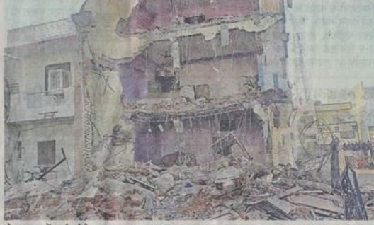
मोहन नगर में कार्रवाई के बाद टूटा मकान।

रंगदारी और सीएम हेल्पलाइन के जरिये ब्लैकमेलिंग करने वालों की जांच भी शुरू