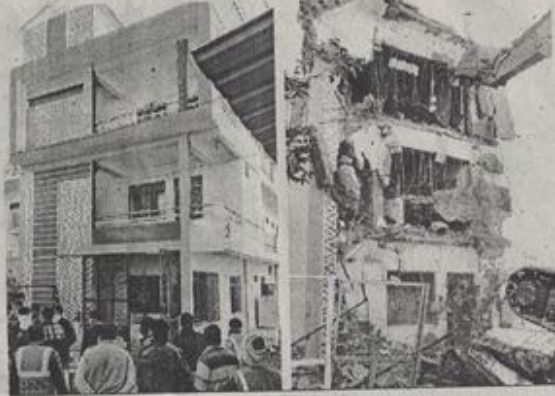
फोटो पहले का व दूसरा बुलडोजर चलने के बाद का