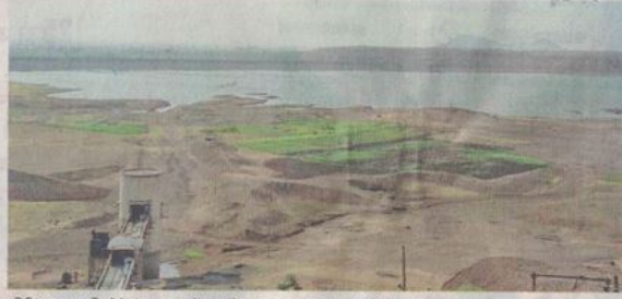
प्रतिदिन रतलामवासियों के कंठ कर करने वाला धोलावड़ जलाशय। ● फाइल फोटो

अभी शहर में टंकियां समय पर नहीं भर पा रही हैं। सोमवार को गंगासागर, शांतिनगर व पोलोग्राउंड टंकी से देर से सप्लाई की गई थी। मंगलवार को भी गंगासागर टंकी से शाम को आपूर्ति की गई। दरअसल अभी नई पाइपलाइन से पटरी पार व पुरानी लाइन से पुरानी टंकियों