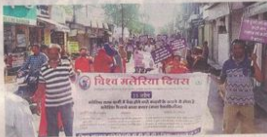
रतलाम में मलेरिया दिवस पर निकली जागरूकता रैली।