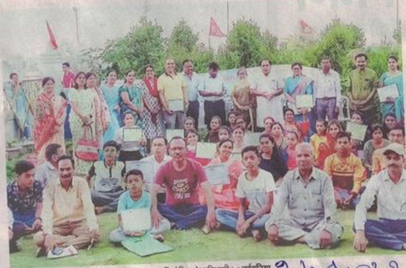
हनुमान ताल पर पृथ्वी दिवस पर अतिथियों के साथ प्रतियोगिता के प्रतिभागी।