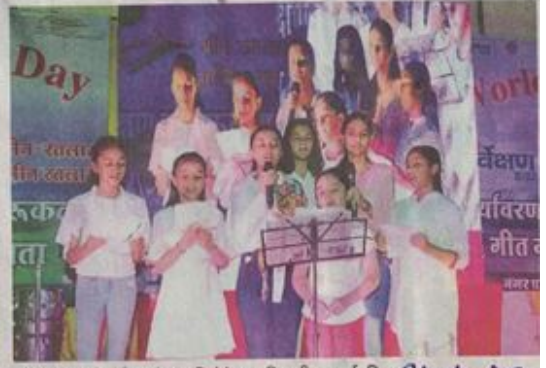
गीत गायन प्रतियोगिता में प्रस्तुति देते हुए प्रतिभागी। • नईदुनिया 24/4/22