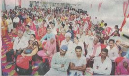
रेलवे स्टेशन पर आयोजित कार्यक्रम में उपस्थित तीर्थ यात्री और सहयोगी।