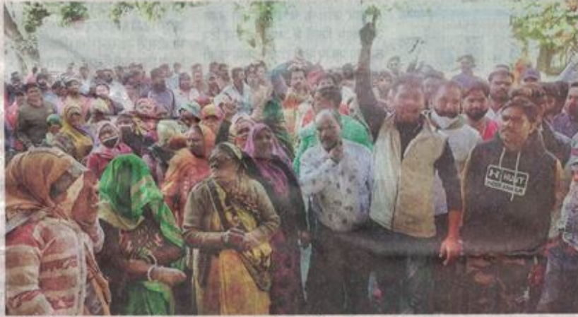
मांगों को लेकर नगर निगम में प्रदर्शन करते हुए सफाई कर्मचारी।

नगर निगम में सफाई कर्मचारियों ने किया प्रदर्शन