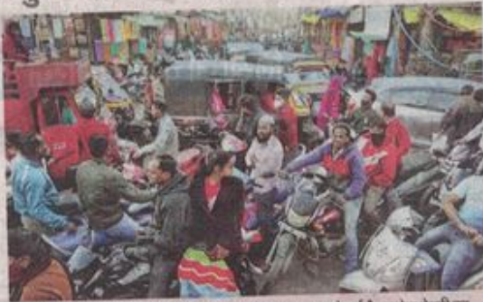
शहर में प्रमुख मार्गों, बाजारों में ट्रैफिक जाम होना आम बात हो गई है। गणेश देवरी पर जाम में फंसे वाहन चालक। ● नईदुनिया

रतलाम (नईदुनिया प्रतिनिधि)। शहर सहित जिले में वाहनों की संख्या लगातार बढ़ रही है। इसकी तुलना में सड़कों को लेकर अधूरी प्लानिंग है। शहर में प्रवेश करने वाले मार्गों को फोरलेन में बदला गया, लेकिन ये चौड़ाई वाहनों के लिए कम दुकानदारों का सामान रखने, पार्किंग के लिए काम आ रही है। किसी भी शहर की तासीर समझने के लिए वहां की सड़कों को आईना माना जाता है। रियासत काल में शहर की स्थापना के समय बढ़ती आबादी को ध्यान में रख सड़कों, चौड़ाई का विकास किया गया। विरासत में मिली तब की चौड़ी सड़कें अब गलियों में बदल गई हैं।