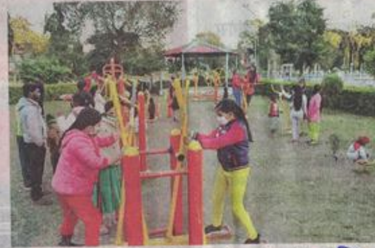
सर्द मौसम में कालिका माता उद्यान में खेलकूद करते हुए बच्चे।