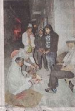
शीतलहर से बचाव के लिए अलाव का सहारा लेते हुए नागरिक।