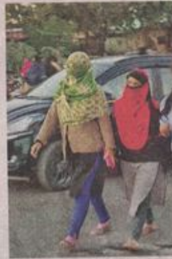
सर्द मौसम में आवाजाही करती हुई युवतियां। • नईदुनिया

ने नर्सरी में पौधों को रात में प्लास्टिक की चादर से ढकने की सलाह दी है। ऐसा करने से प्लास्टिक के अंदर का तापमान 2 से 3 डिग्री बढ़ जाता है, जिससे सतह का तापमान जमाव बिंदु तक नहीं पहुंच पाता। पौधों को ढकते समय इस बात का ध्यान जरूर रखें कि पौधों का दक्षिण पूर्वी भाग खुला रहे ताकि पौधों को सुबह व दोपहर को धूप मिलती रहे। जिस दिन पाला पड़ने की संभावना हो उस दिन फसलों पर गंधक के तेजाब के 0.1 प्रतिशत घोल का छिड़काव करना चाहिए। दीर्घकालिक उपायों में फसलों को बचाने के लिए खेत की उत्तरी पश्चिमी मेड़ों पर तथा बीच-बीच में उचित स्थानों पर वायु अवरोधक पेड़ लगा लिए जाएं तो पाले और ठंडी हवा के झोंके से फसल का बचाव हो सकता है।