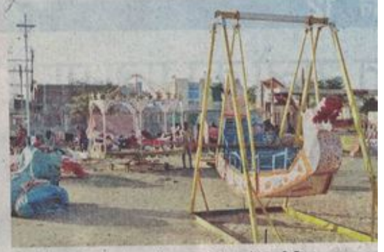
त्रिवेणी मेला परिसर में झूले-चकरी सजना प्रारंभ हो गए हैं। • नईदुनिया

एक जनवरी को निकलेगी रथयात्रा श्री सनातन धर्मसभा व महारुद्र यज्ञ समिति के तत्वावधान में त्रिवेणी तट पर 68वां महारुद्र यज्ञ का आयोजन 24 दिसंबर से तीन जनवरी तक होगा। इसके अंतर्गत प्रतिदिन विभिन्न आयोजन आयोजित किए जाएंगे। 23 दिसंबर को सुबह नौ बजे अगर जी का