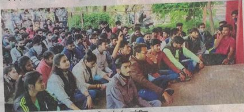
राजिस्थान महाविद्यालय परिसर में धरना देते हुए अभावपि कार्यकर्ता।