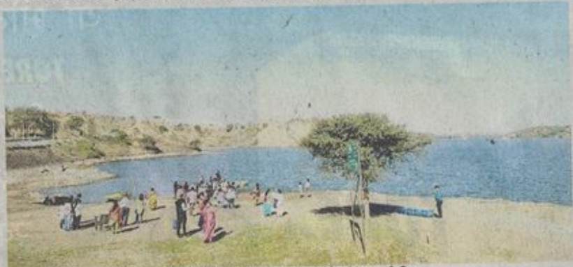
धोलावड़ इंको टूरिज्म पार्क में पर्यटकों के लिए वैली क्रसिंग की व्यवस्था भी की गई है।