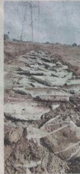
काटेज कालोनी में बनी सीसी रोड कालोनाइजर ने ही तुड़वा दी। • नईदुनिया महंगी होने से वहां कालोनाइजर्स ने ग्राम पंचायतों से अनुमति लेकर ग्रामीण स्तर

शहर से लगे सभी गांवों में काटेज कालोनी : शहर से लगे गांवों में भूमि