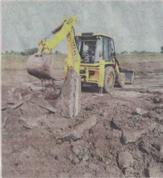
काटेज कालोनी में बनी सड़क जैसीबी की मदद से तुड़वा दी गई। • नईदुनिया

मालूम हो कि खेती की जमीन पर 5500 वर्गफीट व उससे अधिक क्षेत्रफल की भूमि को बड़े प्लाटों में सीमेंटेड सड़क बनाकर बेचा जा रहा है। प्रशासन ने ऐसी तीन कालोनियों में कार्रवाई की है। मांगरोल फंटे पर कालोनी की भूमि खरीदने वालों ने सीमेंटेड सड़क बनाने के बाद मूल स्वामी से सीधे रजिस्ट्री करवा दी। इसमें भी चार-पांच लोग शामिल हैं। इसके चलते निवेश कर मुनाफा कमाने वाले असल लोग दस्तावेजों में सामने नहीं आ पाए हैं। शहर के एक प्रमुख हंडी दलाल की भी इसमें खासी भूमिका है। बताया जाता है कि कार्रवाई से बचने के