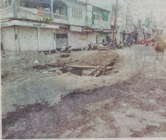
हरदेवलाला की पीपली से तोपखाना रोड क्षेत्र में अधूरा पड़ा निर्माण।

झालानी ने कलेक्टर को अवगत कराया कि इस क्षेत्र में सीवरेज निर्माण के दौरान क्रास-नाला क्षति ग्रस्त होने से नालियों की गंदगी मुख्य मार्ग पर बहने से रोकने के लिए नवीन क्रास-नाली पुलिया स्वीकृत करवाई गई। गत एक माह से अधिक समय से नगर-निगम अधिकारियों और ठेकेदार द्वारा