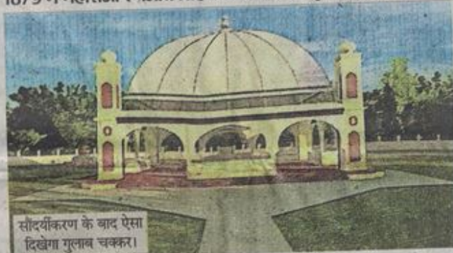
सौंदर्यीकरण के बाद ऐसा दिखेगा गुलाब चक्कर।