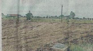
सीसी सड़क के सहारे बनाई गई सीवरेंज लाइन और चैंबर, इस पर भी मिट्टी डाल दी गई है।