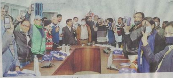
नगर निगम में वाकी-टाकी दिखते हुए अधिकारी-कर्मचारी।

निगम आयुक्त ने बताया कि नागरिकों की सुविधा के लिए इंडौर सहित अन्य बड़े शहरों की तरह नगर निगम भी मोबाइल एप रतलाम 311 तैयार करने जा रहा है। एप नगरवासियों को निगम के साथ संवाद स्थापित करने व निगम के कार्यों को सुगमता से संचालित करने का एक माध्यम