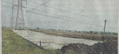
मांगरोल फंटे की अवैध कॉलोनी में बनी सीसी सड़क, जिसे अब मिट्टी डालकर छिपा दिया गया है।