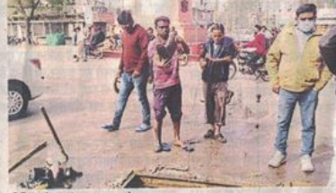
मीडिया देख मंगवाए नए जूते

शहर के विभिन्न जोन में चैंबर, नाले आदि की सफाई के लिए काम करने वाले निगम के करीब 900 से अधिक कर्मचारियों को बगैर संसाधन के ही गंदगी में उतारा जा रहा है, जबकि यह कायदे के