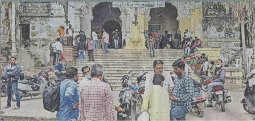
महलवाड़ा स्थित रजिस्ट्रार विभाग में रजिस्ट्री कराने के लिए लगी लोगों की भीड़।

रजिस्ट्रार कार्यालय में रोज होती है 50-60 रजिस्ट्रियां, इसमें आधी से ज्यादा गाइडलाइन से ज्यादा भाव में