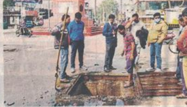
बगैर संसाधन के कर्मचारी को उतारते

रतलाम, भोपाल में सीवर के चैंबर ने दो कर्मचारियों की जान ले ली। सितंबर माह में रतलाम के मोचीपुरा में भी एक कर्मचारी को गंदे नाले की सफाई के लिए बिना सुरक्षा उतारा गया था। इसके बाद सोमवार को शहर के दो बत्ती जैसे व्यस्त रहने वाले चौराहे पर एक बार फिर गंदगी से भरे चैंबर की सफाई के