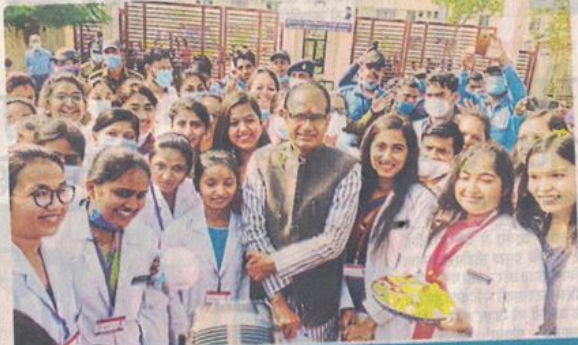
सीएम के आने पर दिखाऊंगा काला झंडा

सीएम विवाह समारोह से लौट रहे थे कि मेडिकल कॉलेज के छात्र-छात्राएं सड़क पर उनके स्वागत के लिए खड़े नजर आए। यह देख सीएम ने काफिरा रुकवाया और बच्चों के स्वागत करने पर उनसे चर्चा की और फिर दोनों के साथ अलग-अलग फोटो भी खिंचवाए। दरअसल पूर्व में सीएम को मेडिकल कॉलेज में ब्राइसेस मैनेजमेंट की बैठक लेना थी जिसमें तीसरी लहर