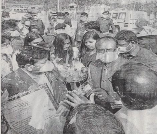
प्रसारण न्यूज़ • रतलाम

हमारा बड़का हुआ महानगर है। वे आगामी जनवरी माह में पुनः रतलाम आएंगे और योजनाओं व कार्यक्रमों के क्रियान्वयन को