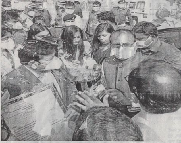
प्रसारण न्यूज • रतलाम

- मुख्यमंत्री श्री चौहान रतलाम में पत्रकारों से रुबरु हुए मुख्यमंत्री शिवराजसिंह चौहान शनिवार को रतलाम आगमन पर हैलीपैड पर पत्रकारों से रुबरु हुए। पत्रकारों से चर्चा करते हुए मुख्यमंत्री श्री चौहान ने कहा कि रतलाम शहर में दोनों डोज का टीकाकरण कार्य शत-प्रतिशत पूर्ण हो गया है। इसके लिए सांसद, विधायकगण, सभी जनप्रतिनिधि, कलेक्टर, प्रशासनिक व स्वास्थ्य अमला तथा मीडिया के बंधु बधाई के पात्र हैं।