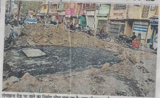
सायर चव्तरा रोड पर नाला निर्माण के लिए खुदाई कर छोड़ दिया है। लोगों को आने-जाने में दिक्कत है।