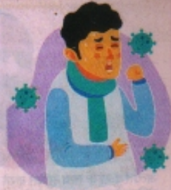
इस महीने जिले की स्थिति