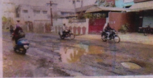
लोकेंद्र भवन मुख्य मार्ग पर फैला नाली का पानी। नई दुनिया 5-1-2021

लोकेंद्र भवन रोड के नाली बार-बार जाम हो जाती है। इसके कारण नाली का गंदा पानी मुख्य मार्ग पर फैल जाता है। सड़क पर बड़े-बड़े गड्ढे होने के कारण गंदा पानी भरा रहता है। इससे जहां यातायात में दुर्घटना फैलती है, वहां आने-जाने वालों को दिक्कतों का सामना