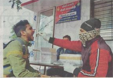
सालाखेड़ी चौकी पर युवक का सैपल लेते हुए स्वास्थ्यकर्मी।