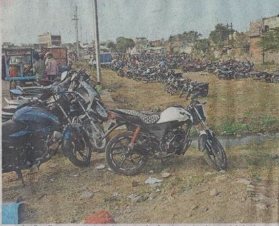
यहां खुले अवैध स्टैंड : संतनगर में दो स्थानों पर, कालागीण भैरव रोड मस्जिद के पास, त्रिवेणी मुक्तिधाम के पास, मोतीनगर की गलियों में, त्रिवेणी मुक्तिधाम से मेला मंच जाने के बीच चार स्थानों पर।

11 दिनों त्रिवेणी मेला 24 दिसंबर से शुरू हुआ है। मेले में आने वाले लोग अपने वाहन पार्क कर सकें। इसके लिए नगर निगम ने दो स्थानों पर ठेके दिए। लेकिन, रविवार को मेले में वाहन स्टैंड के नाम पर दिनभर अवैध वसूली होती रही। इन अवैध स्टैंड पर संचालकों ने बाकायदा बैनर लगाकर स्टैंड शुरू किए और वाहन खड़े करने आने वाले लोगों को रसीदें भी दीं। इससे लोगों को भी पता नहीं चल पाया कि स्टैंड वैध या अवैध। बावजूद नगर निगम के किसी अफसरों के ये अवैध स्टैंड नजर नहीं आए।