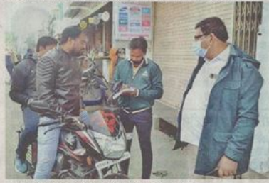
मास्क नहीं लगाने पर जुर्माना वसूलते हुए निगमकर्मियों।

20,000 बच्चे हैं जिले में जो स्कूल नहीं जाते