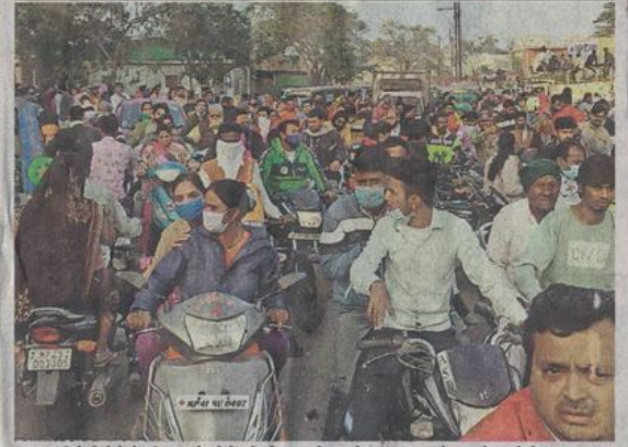
रतलघाम | त्रिवेणी मेले में रविवार को लोगों की भीड़ उमड़ी। इससे कल्याणनगर के सामने वाली रोड पर जाम लग गया। एक घंटे तक वाहन चालक फंसे रहे। यहां ट्रैफिक पुलिस का जवान मौजूद नहीं था।

इधर शाम को कल्याणनगर के सामने लगा जाम, फंसे वाहन चालक