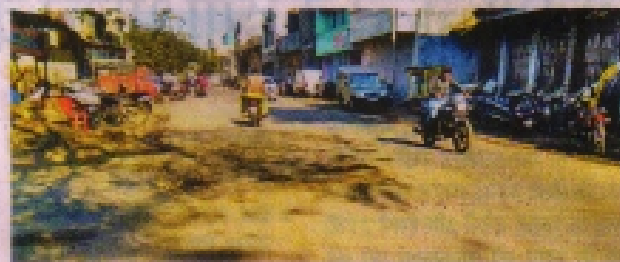
रतलाम के फ्रीमंज रोड की सड़क पर उभरे गधे। नवदुनिया 11-12-20

रतलाम। सीवरेंज एजेंसी द्वारा सड़कों तथा गलियों की खुदाई करके उस का तस छोड़ दिया गया है। परिणाम स्वस्थ जर्जर सड़कों तथा गलियों में उड़ रही धूल से आम नागरिक परेशान हैं। सड़क के बीच में भी बड़े-बड़े गधे हो गए हैं। रेलवे माल गोदाम के लिए फ्रीमंज रोड होकर दिन-रात भारी वाहनों की आवाजाही होती है। सब्जी मंडी से आने वाले वाहन यहां से ही निकलते हैं। खराब सड़क के कारण वाहन निकलते समय आसपास के मकानों में कंपन होने लगता है। वाहनों की आवाजाही से होने वाले शोर के कारण नींद लेना मुश्किल