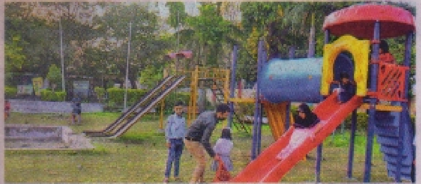
श्री कालिका माता मंदिर क्षेत्र उद्यान में फिसलन पट्टी का आनंद लेते हुए बच्चे।

शहर के उद्यानों को सुंदरता के साथ-साथ बच्चों के मनोरंजन, बड़ों के लिए एक्सरसाइज करने तथा बूढ़ों के लिए आरामदायक बेंचे नगर निगम द्वारा लगवाई जा रही हैं। मुंबई की एक कंपनी से इन उपकरणों को मंगवाया गया है। श्री कालिका माता में यह उपकरण लगे रहे हैं वहीं अमृत सागर तालाब के उद्यान में काम अंतिम दौर में है। मुंबई से आए पिरू सिंह ने बताया कि श्री कालिका माता क्षेत्र उद्यान में ज्यादा उपकरण लगना है इसलिए वहां ओर समय लगेगा, जबकि अमृत सागर तालाब उद्यान में उपकरण कम होने के कारण दो-तीन दिन में वहां का काम खत्म हो जाएगा। श्री कालिका माता क्षेत्र उद्यान में ओपन जिम का साधन ज्यादा है जबकि अमृत सागर तालाब उद्यान में एक ही है।