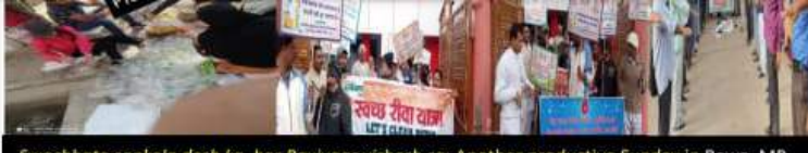
Swachhata sankalp desh ka, har Ravivaar vishesh sa: Another productive Sunday in Rewa, MP